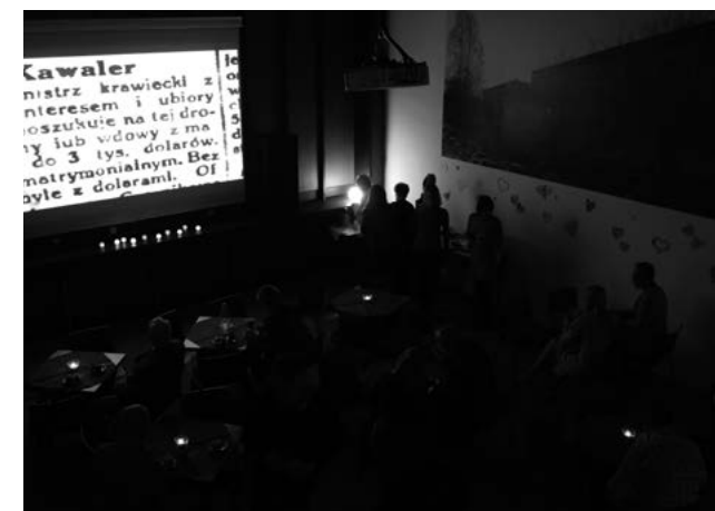
Walentynki z ogłoszenia