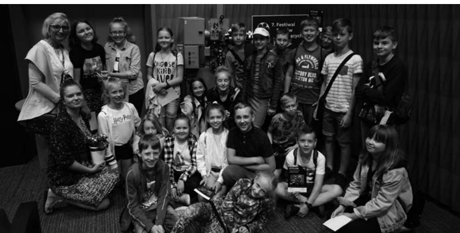
Zakończenie warsztatów filmowych