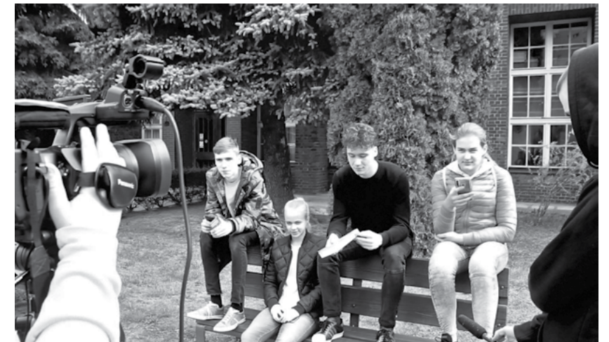
Śladami znanych reżyserów

Dwa cykle spotkań Młodzieżowej Akademii Filmowej pokazały film od tzw. „kuchni”. Analizując wybrane sceny uczestnicy zobaczyli jak scenariusz, styl reżysera, światło, ustawienia kamery czy zastosowany