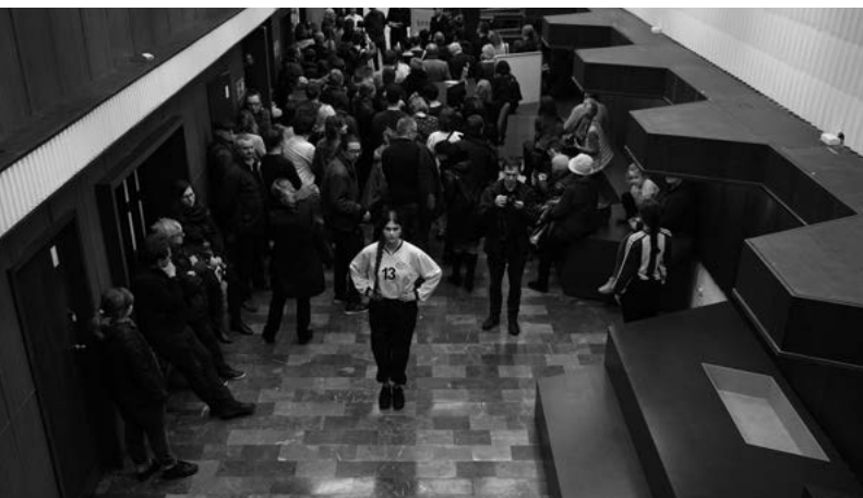
HEXEN TABOR GORE

i barw oraz starannie zaplanowanych relacji przestrzennych. Mimo oszczędności i medytacyjnej skrupulatności, jest to praktyka zdolna pomieścić eksplozję zróżnicowanych i wielowymiarowych perceptów, w jakich uobecniają się autentyczne relacje i zdarzenia. Instalacja site specific, którą artystka zrealizowała w MOS, doskonale mieści się w fizycznych ograniczeniach użytych materiałów, powierzchni płyt gipsowych i przestrzeni galerii. Bez konieczności sięgania po zewnętrzne narzędzia dyskursywne, na bazie samych tylko substancji