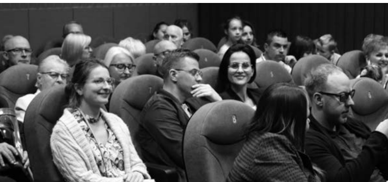
Pokaz filmu Gorzów w różowych okularach - wideoportrety