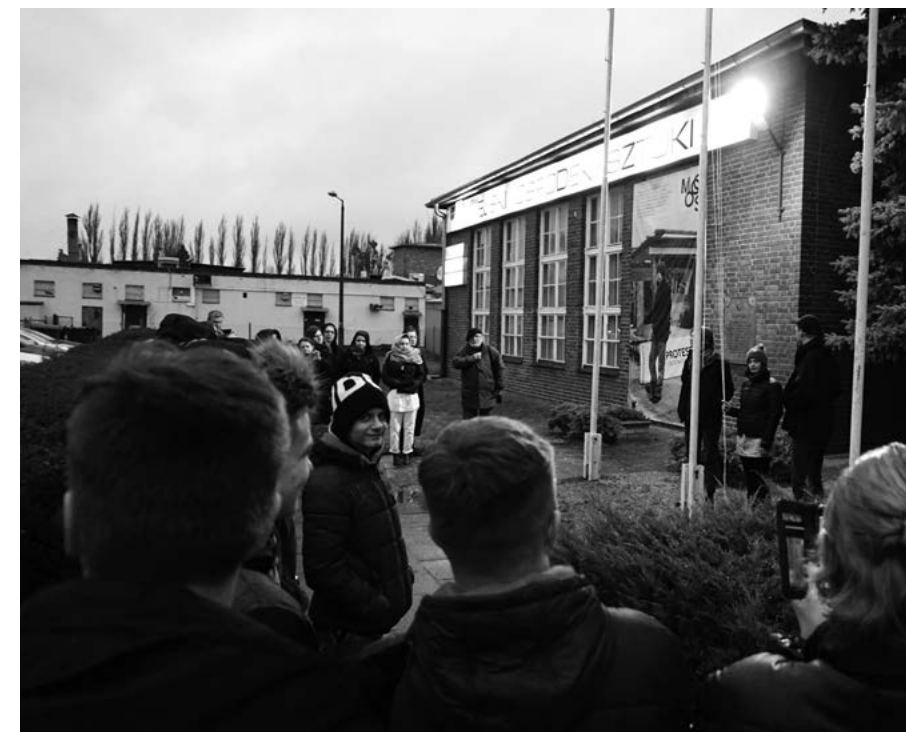
HEXEN TABOR GORE