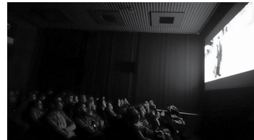
Pokaz filmu Substytut , reż. Jakub Hołyński

Filmów pokazaliśmy w Kinie 60 krzeseł. Widzowie, jak co roku, zobaczyli tytuły nagradzane i doceniane na najważniejszych światowych festiwalach. Jak zwykle w programie nie zabrakło premier, przedpremier oraz głośnych filmów sezonu. Zaprezentowaliśmy: „Synonimy”, „Petra”, „Nie obchodzi mnie, czy przejdziemy do historii jako barbarzyńcy”, „Trafikant”, „Tajemnica Henriego Picka”, „Pamiętki Claire Darling”, „Yuli”,