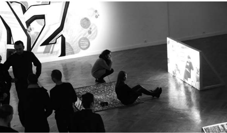
ZACHÓD PACHNIE CZEKOLADĄ

Wystawie towarzyszyły wydarzenia dodatkowe: cykl wykładów poświęconych historii figuracji w Polsce